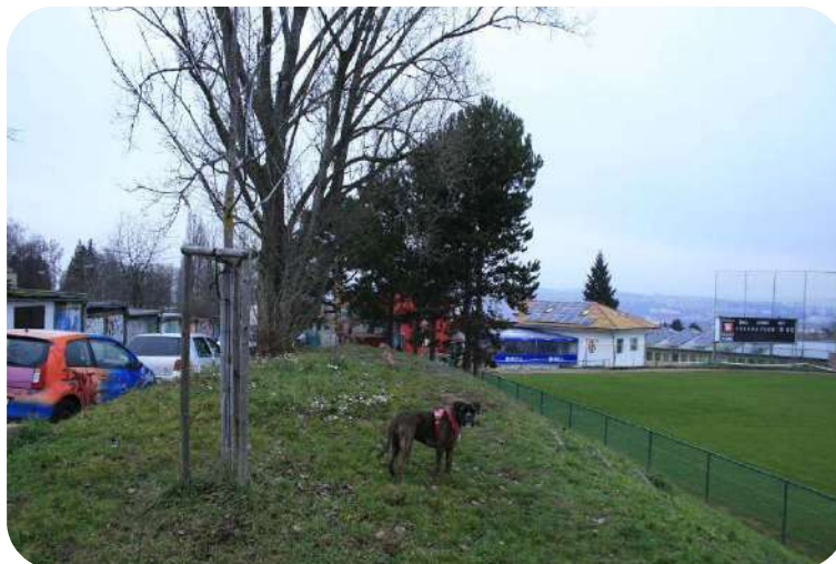
Vágní prostor mezi zahrádkami a baseballovým hřištěm

Narážel jsem na základní problém, který se netýká produktivity či neproduktivity, ale čistě toho, že si území musím velmi důkladně zanalyzovat a pochopit ho, než na něm budu řešit problémy Brna, a tím ho adekvátně vytížit. Velká hodnota mé diplomové práce je pro mě popis celého území. Popsat ho ne na základě toho, že s ním chci něco dělat nebo přinést, že já architekt přicházím do území a jdu jej udělat lepším. Místo toho se ptám, o čem území je, v čem spočívá, jak funguje, kdo v něm existuje. Až to území do hloubky pochopím, tak se pokusím stanovit diagnózu, ale nebudu ji předjímat.