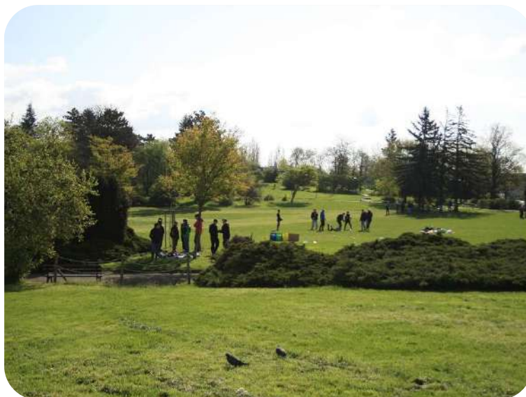
Jarní atmosféra parku na Kraví hoře

Jakým způsobem se udržitelnost protнула s Kraví horou?