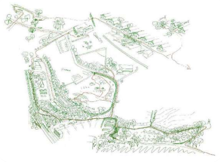
Skica jihozápadní strany Kraví hory

Našel jsem tedy v našem oboru díry a snažil se v rámci řešeného území ukázat, jak přistupovat k místu nerůstově, a hlavně vyzdvihnout jeho kvality a pracovat s nimi.