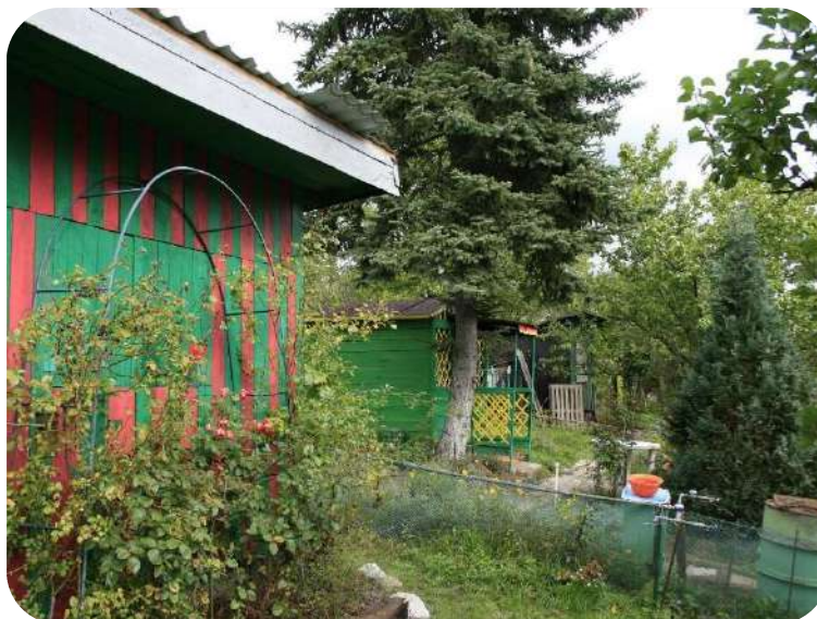
Malovaný zahradní domek na okraji kolonie

Můžeš nějak popsat, jakou metodou jsi území poznával?