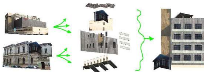
Koláž- recyklace. Znovu použití stavebního materiálu z obchodního domu Prior

V dřevěných likusácích vytváří komunita architektů, umělců i hudebníků zajímavé prostředí plné lidí, kteří nemohou, nebo nechtějí mít kanceláře a ateliéry za obchodní ceny ve městě. Nevlezli se do centra, šli na periferii. Snažil jsem se vytvořit strategii, jak s kasárnami (domy, které se rozpadají) postupovat. Komunita zde sídlí právě proto, že se ty baráky rozpadají, ale nemůže tam být na věky, protože se jednou rozpadnou. Což je věčný paradox kreativních komunit, které se ujmou místa nezájmu, zhodnotí je svým bytím, vzbudí zájem o území, do kterého začnou přitékat finance a až se celé stane lukrativním, komunitu vytlačí. Proto jsem zvolil taktiku postupného nenápadného opravování, nahrazování místo jednorázového radikálního zásahu.