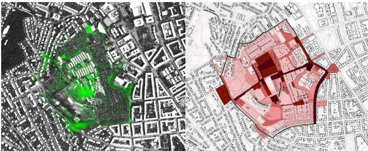
Mapa míry nezájmu a mapa míry zájmu

Následoval negativ. Pokud máme území, o která bychom se měli zajímat, tak co jsou místa, kterými se zabývat nemusíme. Místa, která mají kvalitu vágnosti. Principem vágnosti je, že ji nikdo nenaplánoval. Nedefinovanost nemůžu plánovat, můžu ji jen nechat na pokoji a kopat na sousedním písečku.