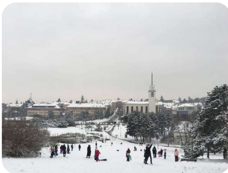
Zimní atmosféra parku na Kraví hoře

Četl jsem teorie o nerůstu, přicházel jsem na to, co vlastně urbanismus dokáže vyřešit a měnil se mi pohled na architekturu.